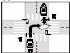
④⑤とも両信号で進入した場合